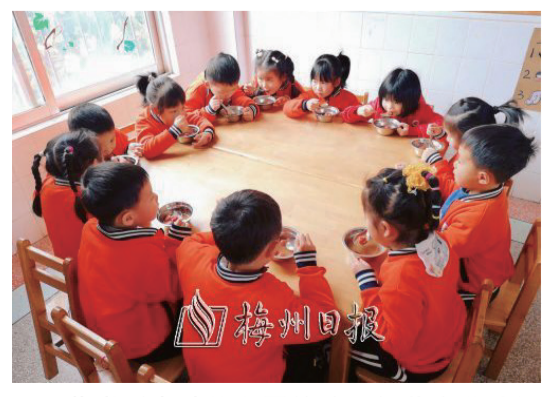
蕉嶺縣實驗幼兒園的孩子們共享美味湯圓。