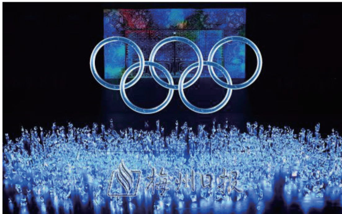
2月4日晚，第二十四屆冬季奧林匹克運動會開幕式在北京國家體育場舉行。這是開幕式上的“冰雪五環”環節。

據介紹，在此次冬奧會開幕式上，長徵天民公司運用了諸多航天技術。“如奧運五環的結構特點是异形、大跨距、低剛度，它