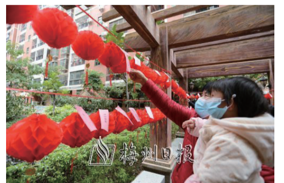
梅縣區程江鎮大新城社區在鴻鑫園小區開展元宵主題活動，不少居民前來參與猜燈謎。

元宵節前後，我市各大景區景點張燈結綵，精心準備了賞花燈、猜燈謎、品民俗等精彩紛呈、原汁原味的特色活動，為節日出游的市民帶來別樣的體驗。在國家3A級旅遊景區客都人家文化旅遊度假區，元宵節期間為遊客持續推出了璀璨烟花秀、街區表演、彩繪花燈、提燈游園、趣味投壺、燈光秀、民俗剪紙等活動，讓廣大市民遊客在喜慶氛圍中感受年俗風情，進一步傳承弘揚優秀傳統文化。（賴運香 丘瓊 吳麗伶 侯珍妮 賴鋒 張怡佳）